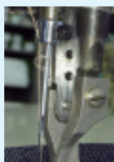
【半掛けによる上糸切れ】